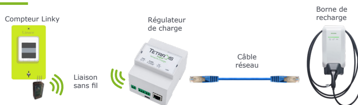
SCHÉMA D'IMPLANTATION DE LA SOLUTION TRC

Conformément au Code général des impôts, annexe IV Article 18 ter A, le système de charge doit être pilotable. Cela signifie qu'il doit être doté d'une capacité à moduler la puissance appelée ou à programmer la recharge du véhicule électrique.